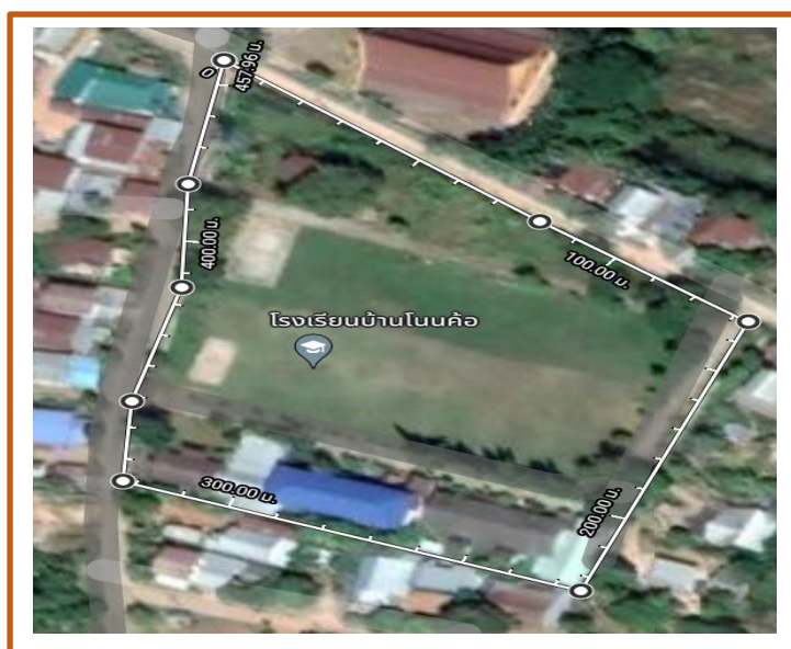
พื้นที่โรงเรียนบ้านโนนค้อ