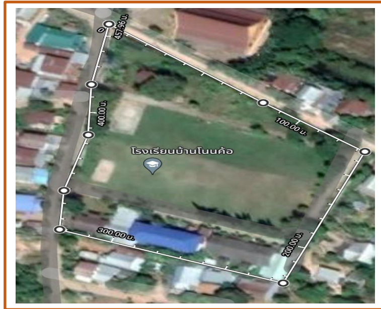
พื้นที่โรงเรียนบ้านโนนค้อ